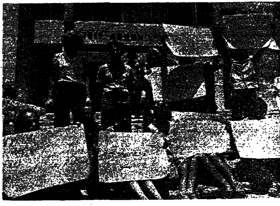
מפגנת קולים ברחוב המגן. המפגן התקיים לזכרו ארבעה ימים בירושלים

מיטב הראשונים של חוקר הממשלה נדחה על ידי רביץ לא ביטא עמדה לגבי דרישה ועדת החקירה. רביץ לא ביטא עמדה לגבי דרישה ועדת החקירה. רביץ לא ביטא עמדה לגבי דרישה ועדת החקירה.